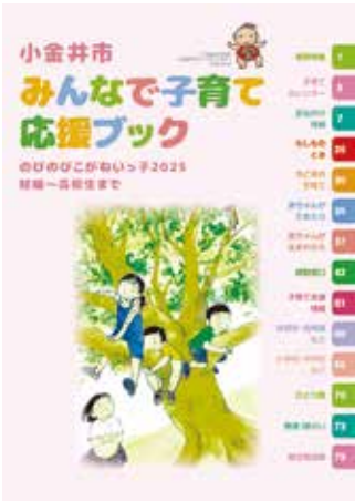
のびのびこがねいっ子2025

申 12月1日～22日(消印有効)に、郵送、ファクスまたは直接、所定の様式(子育て支援課、こども家庭センターで配布または市ホームページからダウンロード)に必要な事項を明記し、子育て支援課子育て支援係(〒184-8504住所不要・市役所第二庁舎3階☎042-387-9836FAX042-386-2609)へ