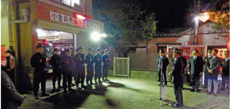
消防団歳末特別警戒