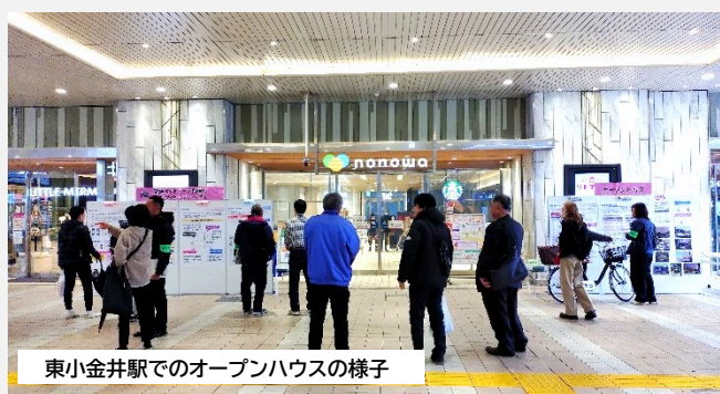
東小金井駅でのオープンハウスの様子