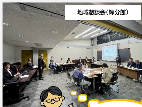
地域懇談会(緑分館)

お忙しい中、多くのご意見ご関心をお寄せくださりありがとうございました。今後、パブリックコメントも予定していますので、引き続き皆様の声をお聞かせください。よろしくお願いいたします。