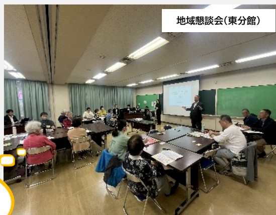
地域懇談会(東分館)