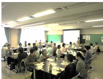
声格を変える発声と滑舌練習

「実践と経験 いきいきとコミュニケーション」というテーマをもとに、館内座学・野外研修で暮らしの中のワクワクをたくさん見つけることができました。