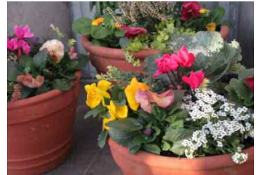
ハボタン、パンジー、アリッサム