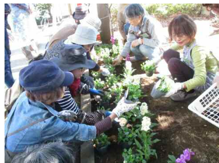
チューリップはアンジェリカ、サンネ、タルダ、ライラックワンダーの4種

食品リサイクル堆肥 主成分：窒素全量 2.9% リン酸全量 4.5% カリ全量 1.3% 炭素窒素比 6.2