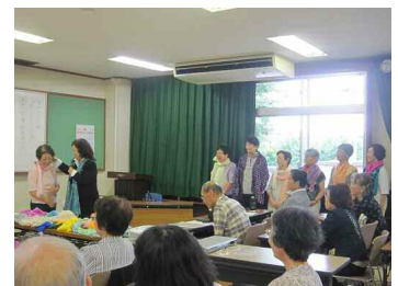
男と女のおしゃれ術

今年度も歴史や俳句などの学習のほか、野外研修や体操、落語など、体を動かしたり笑ったりできる様々な講座を実施し、回を重ねるごとに参加者同士の交流も深まっています。