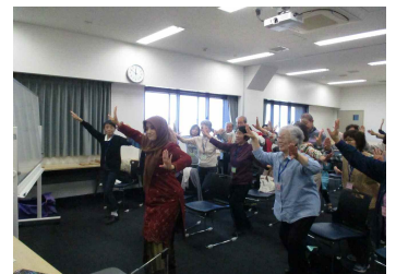
インドネシアの楽器と踊り

「今までやったことのない新しいものに出会えたらいい」「もっと親密なつながりができるような工夫がほしい」後半に向けて、様々な意見をいただきました。