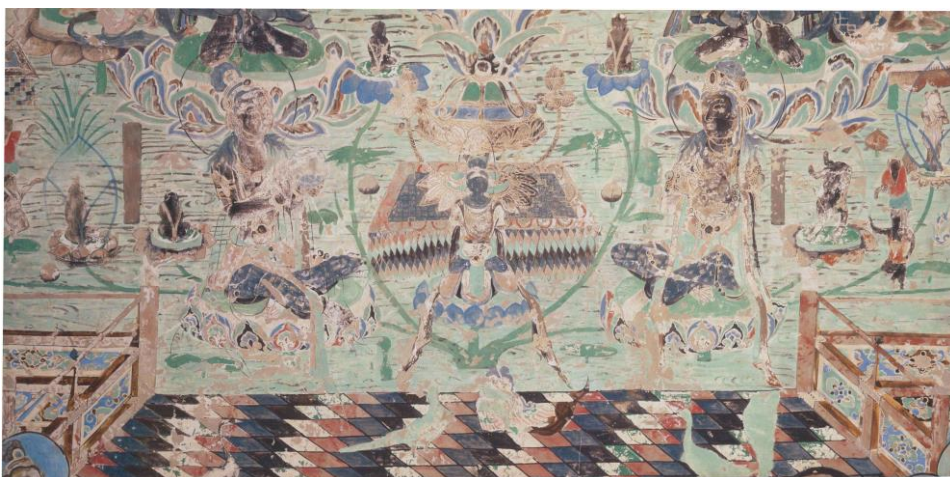
《敦煌莫高窟壁画第 220 窟 南壁 阿弥陀浄土変相部分（初唐）》模写 國司 華子 昭和 63 年度 86.0cm×165.0cm

敦煌莫高窟と法隆寺の金堂壁画は日本の仏教絵画の源となるものです。台東区が所蔵する両壁画の模写を通じて、ほとけとともに浄土描写を学ぶことができます。貴重な作品に触れることができるまたとない機会を、どうぞお見逃しなく！